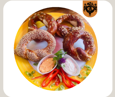
BREZENRING Breze als Ring. • Kürbiskerne • Sesam • Sonnenblumenkerne • gemischt