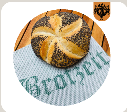
MOHNSEMMELE Klassische Weizensemmel mit Mohn bedeckt.