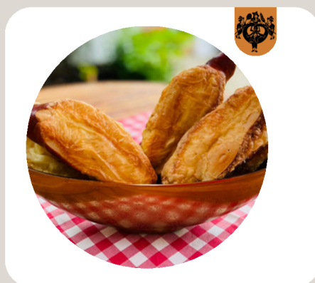
KÄSESTANGERL Brezenteig. Überbacken mit Gouda.