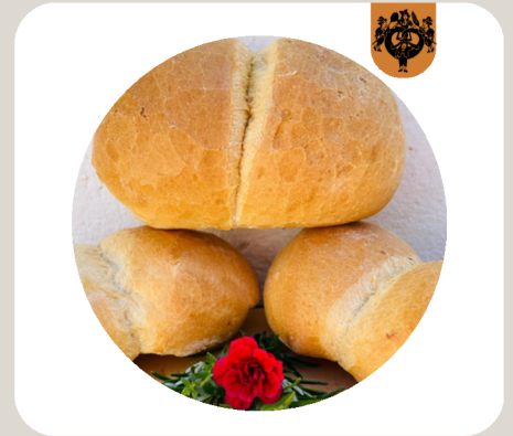
KRUSTENWECKERL Baguetteteig: Weizensauer. Lange Teigführung. Viel Zeit für die Enzyme → Gutes Aroma und längere Frischhaltung. Außen knusprig, innen fluffig.