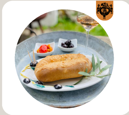
BAGUETTE RASPERL Baguetteteig: Weizensauer. Lange Teigführung. Viel Zeit für die Enzyme → Gutes Aroma und längere Frischhaltung.