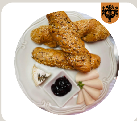
KORNSPITZ Weizenkornmischung. • Salz und Kümmel • Sesam • Gemischte Körner