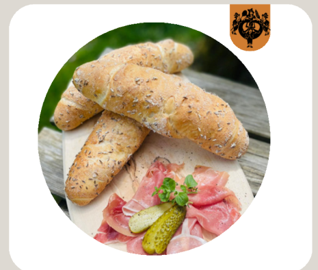
MÜNCHNER STANGERL Baguetteteig: Weizensauer. Lange Teigführung. Viel Zeit für die Enzyme → Gutes Aroma und längere Frischhaltung. Mit Kümmel verfeinert.