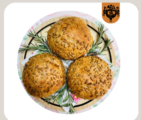
SONNENBLUMENSEMMELE 100% Weizenvollkornmehl. Sonnenblumenkerne.