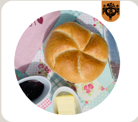
KAISERSEMMELE Klassische Weizensemmel.