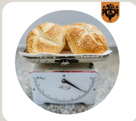
SESAMSEMMELE Klassische Weizensemmel mit Sesam bedeckt.