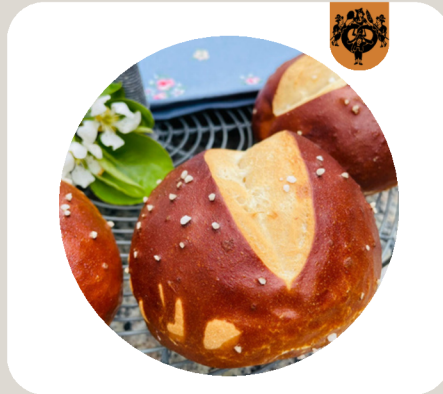
LAUGENSEMMEL Breze als Semmel.