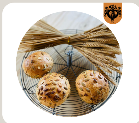
KÜRBISKERNSEMMELE 100% Weizenvollkornmehl. Kürbiskerne.